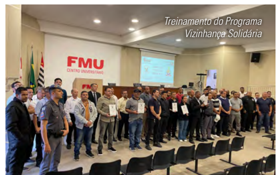
Treinamento do Programa Vizinhança Solidária

Para o Soldado, cabe a cada um melhorar sua segurança e a única forma para isso é comunicar o 190. “Toda denúncia é essencial para melhorar a segurança