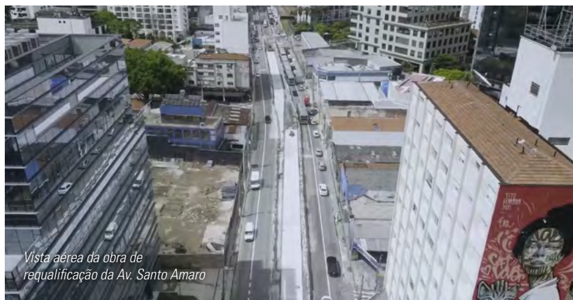
Vista aérea da obra de requalificação da Av. Santo Amaro

As obras na Av. Santo Amaro seguem em ritmo constante. Já é possível notar a nova faixa para o corredor de ônibus nas primeiras quadras da avenida com a implantação do pavimento rígido, seguindo seu novo traçado e com a nova adutora Sabesp no canteiro central, para trazer melhorias para a região.