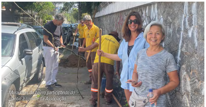
Moradoras do bairro participando do plantio à convite da Associação