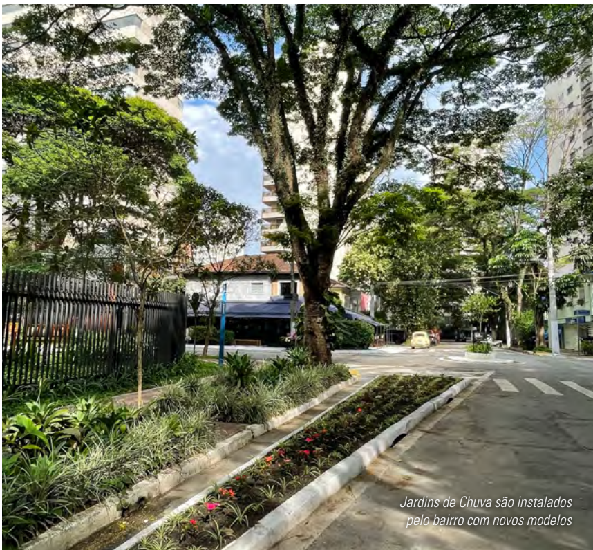
Jardins de Chuva são instalados pelo bairro com novos modelos