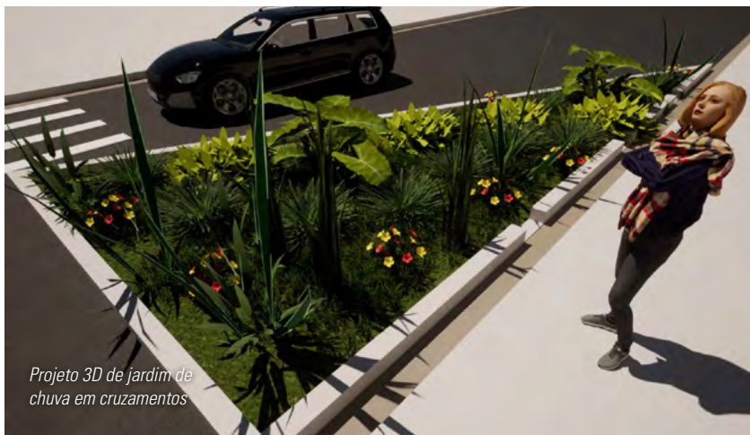
Projeto 3D de jardim de chuva em cruzamentos