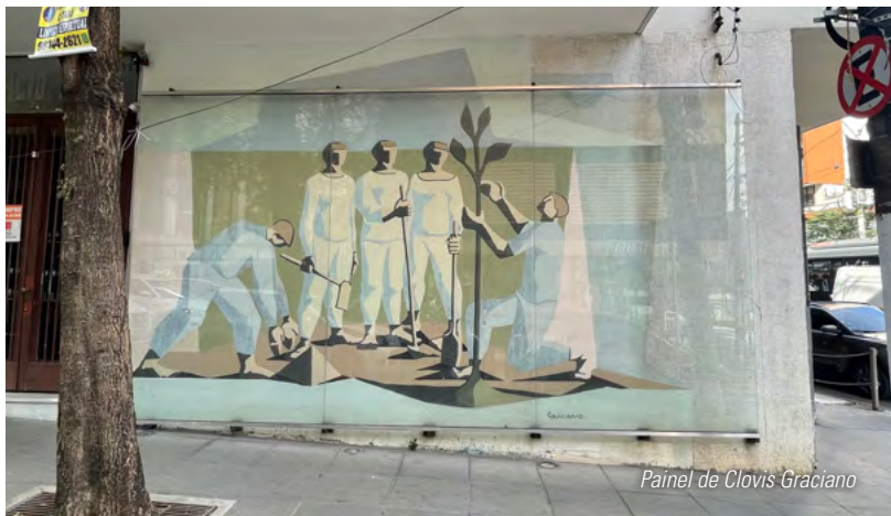
Painel de Clovis Graciano

Na Rua João Lourenço, número 797, é possível se deparar com o Edifício Bial, desenhado pelo arquiteto Abelardo Souza. Na frente, a construção conta com um painel executado em 1995 como homenagem aos trabalhadores, feito de pastilhas pelo desenhista e ilustrador brasileiro Clóvis Graciano, nascido em Araras-SP. Inicialmente um designer de placas de ferrovias, se fixou no mundo das belas artes após se mudar para a capital do seu estado, onde se tornou famoso por seus murais figurativistas que abordavam temas sociais.