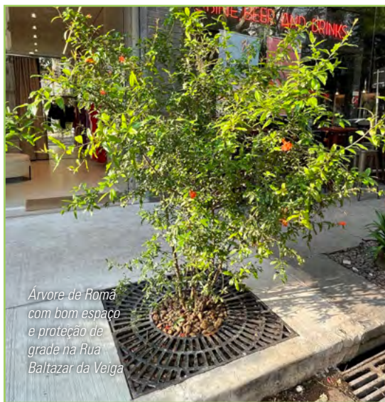
Árvore de Romã com bom espaço e proteção de grade na Rua Baltazar da Veiga

Divirta-se caminhando pelo bairro e descubra curiosidades das árvores apontando a câmera de seu celular para os QR codes disponibilizados em seus troncos!