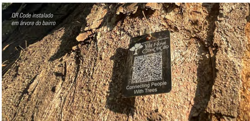
QR Code instalado em árvore do bairro

Em suma, o resultado foi positivo e todos os riscos podem ser reduzidos mediante aplicação dos manejos