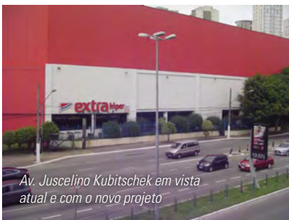
Av. Juscelino Kubitschek em vista atual e com o novo projeto

Com o aumento de rotas e o retorno da capacidade máxima de pousos e decolagens, além da Vila Nova, outros dez bairros, entre eles Moema, Jabaquara, Itaim Bibi e Jd. Lusitânia, estão sofrendo com o incômodo dos ruídos.