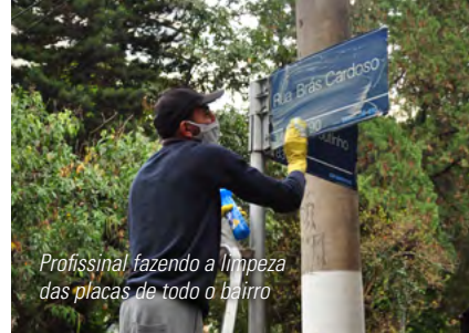
Profissional fazendo a limpeza das placas de todo o bairro