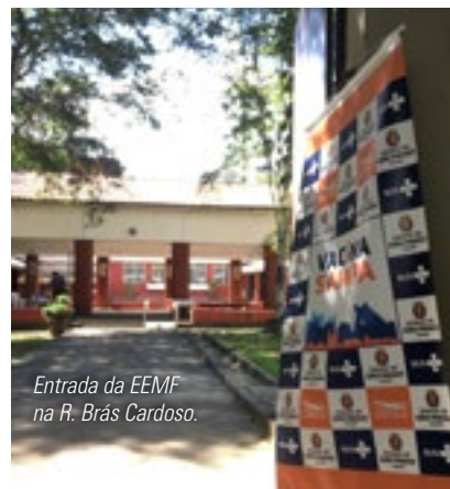
Entrada da EEMF na R. Brás Cardoso.

Em tempo! No momento, só podem ser imunizadas grávidas e puérperas que apresentem comorbidades, podendo tomar somente as vacinas CoronaVac e Pfizer.