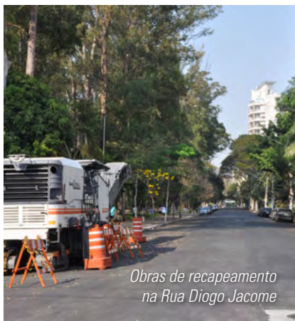
Obras de reaparelhamento na Rua Diogo Jacome