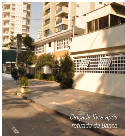
Calçada livre após retirada da Banca