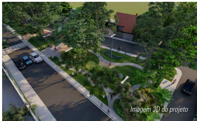
Imagem 3D do projeto