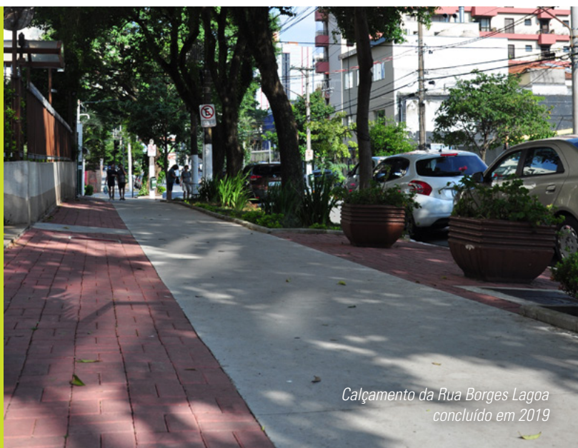
Calçamento da Rua Borges Lagoa concluído em 2019

A R. Afonso Braz foi uma das ruas incluídas no Plano Emergencial de calçadas, no intuito de torná-las acessíveis a todos e facilitar a mobilidade urbana. A Prefeitura fará a reforma e adequações padronizando todo calçamento. Aos moradores e estabelecimentos comerciais caberá somente a conservação de suas respectivas calçadas após a reforma.