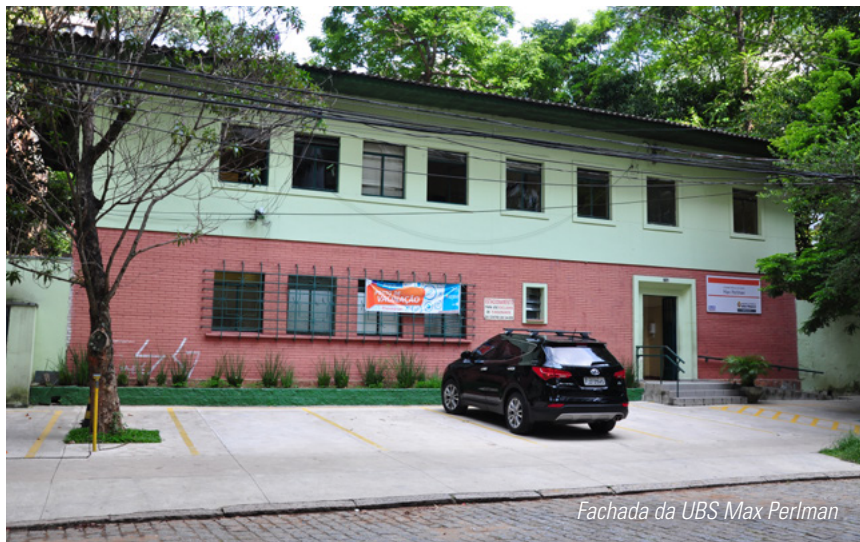
Fachada da UBS Max Perlman

Saúde é direito de todo cidadão, e temos aqui na Vila Nova, um local apto a atender nossa comunidade. A Unidade Básica de Saúde do bairro conta com Clínica Geral, Pediatria, Ginecologia, acompanhamento pré-natal e equipe de Saúde Bucal, para moradores, trabalhadores e estudantes da região.