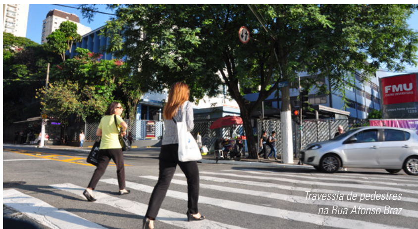
Travessia de pedestres na Rua Afonso Braz

Você tem consciência das regras que seguimos diariamente para o bom convívio no trânsito? Sem elas, tudo seria um caos! Segundo as estatísticas divulgadas pela Prefeitura de SP, em 2018, aqui na capital, o número de motociclistas mortos ultrapassou o de pedestres.