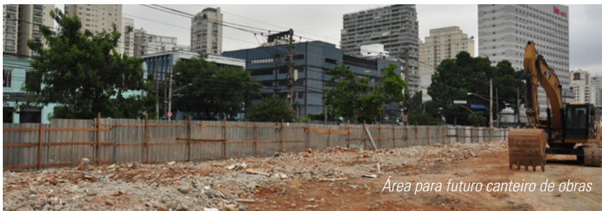
Área para futuro canteiro de obras

Já caminhou pela Av. Santo Amaro ultimamente? Se o fizer, verá que as demolições já estão acontecendo, como o prédio na altura da R. Afonso Braz, em frente à FMU. Futuramente teremos ali um canteiro de obras, e depois, uma praça, que servirá para viabilizar o retorno seguro dos automóveis e ônibus em direção à R. Afonso Braz. Em ritmo mais lento que o programado, as preparações para a nova Santo Amaro já começaram. Acompanhe nossa página do Facebook para ter novidades em primeira mão!