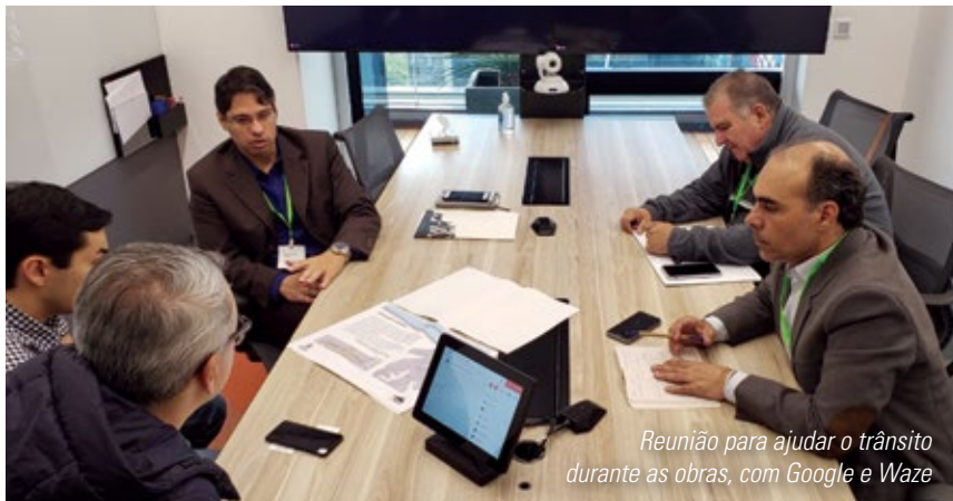
Reunião para ajudar o trânsito durante as obras, com Google e Waze

As obras na Avenida Santo Amaro foram iniciadas com as demolições dos imóveis já desapropriados. Em breve será necessária a interdição de parte da Avenida, com impacto importante no trânsito do bairro.