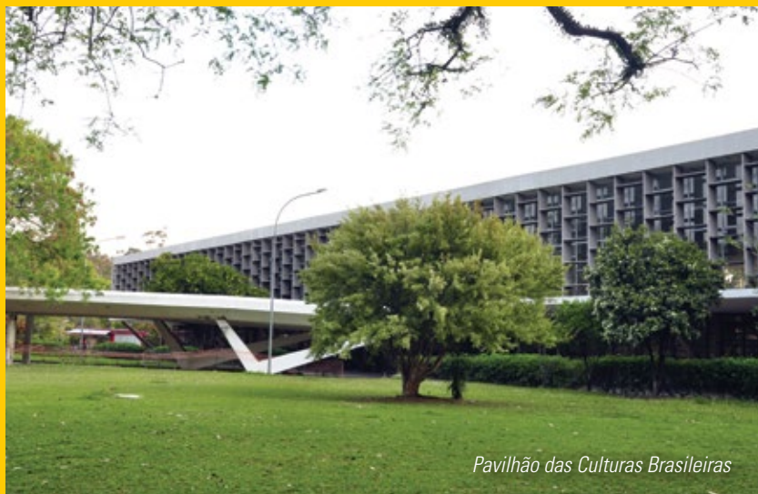
Pavilhão das Culturas Brasileiras

Como vizinhos do Ibirapuera, desfrutamos do maior parque urbano da cidade, tombado como patrimônio histórico. Mas temos uma Concessão ainda não consumada e o Conselho Gestor do Parque continua descontente com a forma que o Plano Diretor foi elaborado. Entenda por quê.