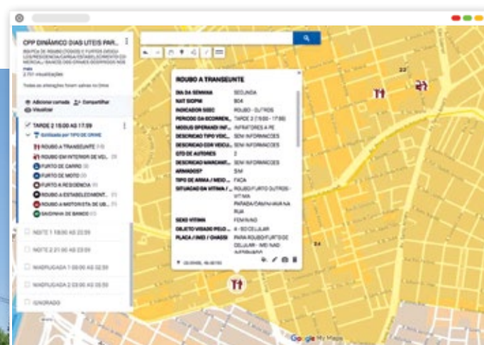
Interface entre dados de B.O.s no Google Maps