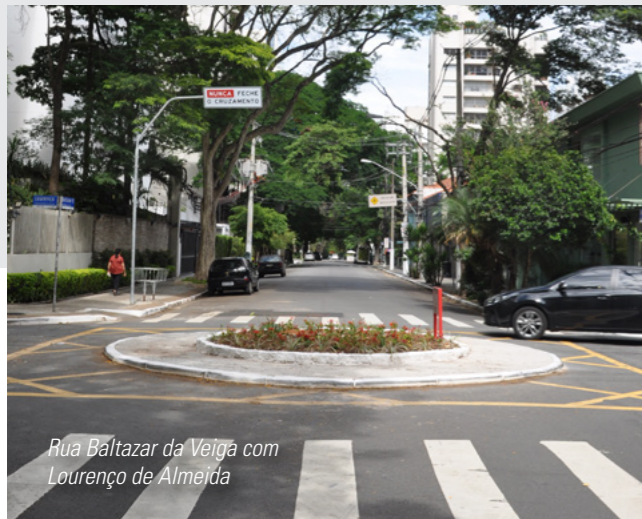
Rua Balthazar da Veiga com Lourenço de Almeida

A AMVNC vem solicitando junto a CET a instalação de faixas elevadas para pedestres - ou lombofaixas - no bairro, principalmente no perímetro das escolas e praças, para proporcionar mais segurança aos alunos e pedestres em geral. Está em estudo a implantação de uma primeira fase de 20 lombofaixas no bairro.