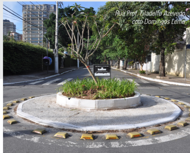
Rua Prof. Filadelfo Azevedo com Domingos Leme