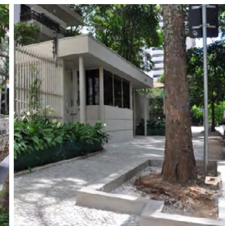
Rua Lourenço de Almeida

Muita gente sabe que a conservação das calçadas é responsabilidade do cidadão. O que muitos ignoram é que, ao cuidar do passeio público, é necessário dispensar uma atenção especial às árvores que ali estão. A calçada tem que cumprir seu papel de permitir os deslocamentos das pessoas, favorecer as interações e valorizar o ambiente urbano. Mas também deve favorecer a permeabilidade do solo. Mostramos aqui dois bons exemplos do nosso bairro (na Rua Bueno Brandão, 134 e Rua Lourenço de Almeida, 882). Que venham outros mais!