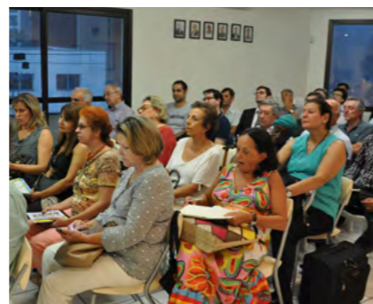
Associados de ambos os bairros na sede da Sojal

A Prefeitura Regional diz que “a Coordenadoria de Projetos e Obras da Prefeitura Regional Vila Mariana está oficializando a Ilume (Departamento de Iluminação Pública) para estudo e possível intervenção no local”.