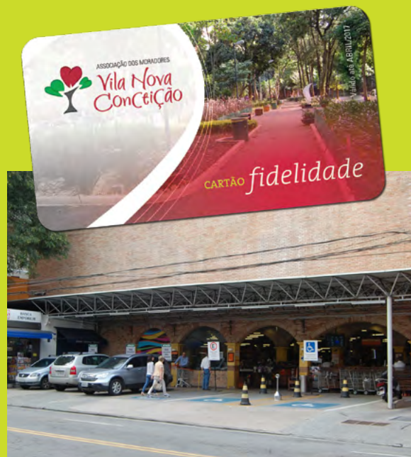
Rua Afonso Braz, 431, Vila Nova Conceição, Tel. 3848-3700

Produtos de qualidade, atendimento personalizado. É assim que, desde sua fundação, em 1991, a rede de supermercados Emporium São Paulo procura deixar o momento da compra mais agradável e prático aos consumidores. As lojas oferecem a consultoria de uma equipe especializada em nutrição, sommeliers, uma padaria com os mais variados produtos e uma rotisseria própria com deliciosos pratos para o dia-a-dia ou para uma data especial. O bazar da rede possui produtos das melhores marcas, além de uma linha de congelados de marca própria, Emporium São Paulo, incluindo pratos light, massas, carnes, sopas, entre outros. Parceira da Associação dos Moradores da Vila Nova Conceição desde 2012, a rede oferece 5% de desconto em qualquer compra, para todos os associados.