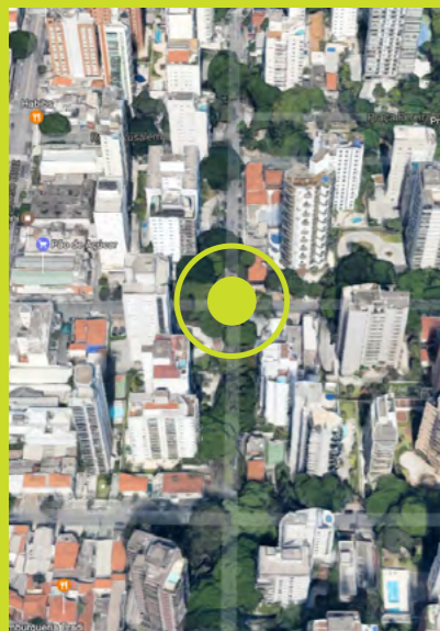
Balthazar da Veiga x Lourenço de Almeida

Haas acredita que, além de resolver três cruzamentos muito perigosos, esse diálogo será o pontapé inicial para implantar um sistema de traffic calming mais abrangente, visando aumentar a segurança e devolver qualidade de vida para o bairro. “Será também um bom exemplo de como Prefeitura Regional, CET e Associações de Bairro podem trabalhar em conjunto com o mesmo objetivo”, finaliza Haas.